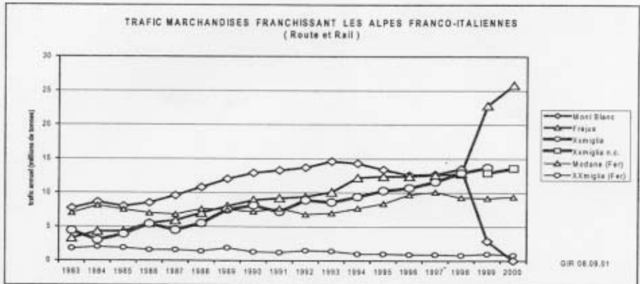
Tableau 1 – Trafics marchandises routiers et ferroviaires

Le plein effet de la fermeture du Mont Blanc (suite à l'accident du 23.03.99) se traduit par un report exclusivement routier [pour l'essentiel sur le Fréjus et modérément sur le Montgenèvre (1,4 Mt) non représenté ici]. A Ventimiglia, la solution de continuité résultant d'un nouveau mode de décompte ne doit pas occulter l'inquiétante inflation d'un trafic routier maralpin nettement découplé du reste du trafic alpin franco-italien.