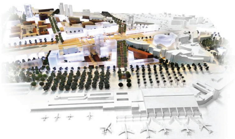
Figure 6 : maquette du Grand Arénas et de l'axe du pôle, depuis la Promenade des Anglais

Afin de conforter cette vocation, le site fera également l'objet d'un programme de renouvellement urbain du tissu existant, une recomposition et une modernisation de l'armature commerciale, le tout accompagné d'un programme de mise en valeur du paysage.