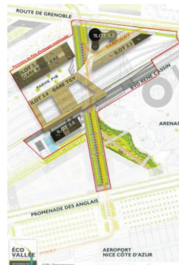
Figure 7 : plan de masse du projet à terme, au cœur du quartier Grand Arénas

Ainsi, les espaces publics constituent à eux seuls une opération que l'EPA pilote en partenariat avec les autres acteurs du projet du Grand Arénas pour une conception d'ensemble cohérente. Ces espaces sont structurés autour d'un axe nord-sud support des transports collectifs en site propre pour la ligne est-ouest du tramway, une voie bus dédiée dans chaque sens, une piste cyclable et des cheminements piétons. Cet axe a été dessiné dans la continuité de la future voie de 40 m qui dessert la plaine du Var.