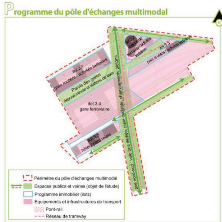
Figure 1 : programme du pôle d'échanges multimodal