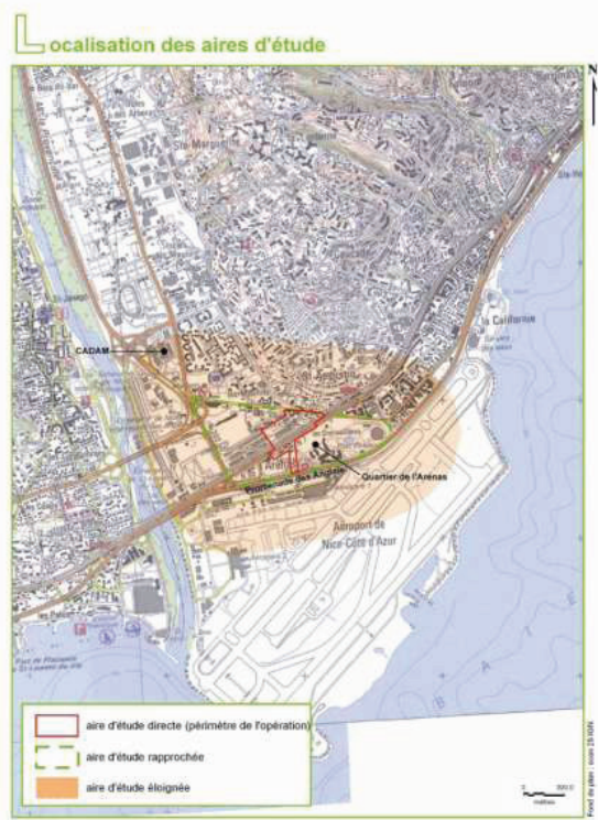
Figure 3 : carte de localisation des aires d'étude

Les thèmes relatifs à la socio-économie tels que l'analyse de la démographie, de l'emploi sont toutefois analysés sur des aires plus larges.