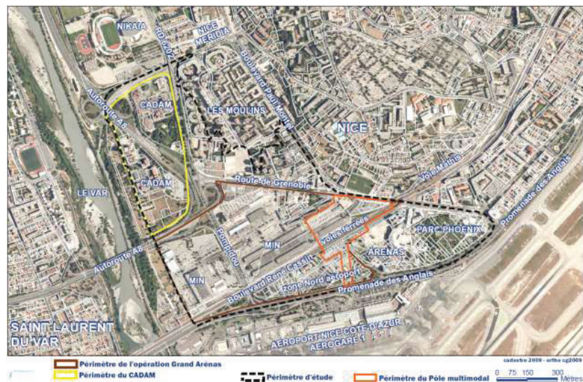
Figure 2 : périmètre du projet dans son environnement urbain

Cet espace est caractérisé par une juxtaposition d'utilisations du site sans lien particulier entre elles rendant le lieu très inhospitalier pour les piétons ou les modes de transport doux. Le mode automobile tient une importance particulière dans l'utilisation de l'espace via des infrastructures routières ou des zones de stationnement de surface.