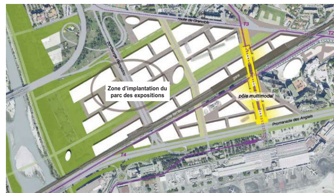
Figure 5 : schéma d'insertion du scénario retenu dans son contexte à long terme

Après concertation avec l'ensemble des acteurs (Etat/SGAR-DREAL-Préfecture-DDTM, Région PACA, Conseil général des Alpes-Maritimes, Métropole NCA, SA Aéroports de la Côte d'Azur, CCINCA, RFF, SNCF) le scénario optimal retenu est le scénario suivant :